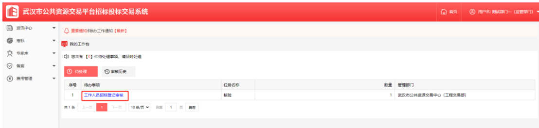
如图：武汉市中心目录内项目由工程交易部进行核验，区交易中心未区分